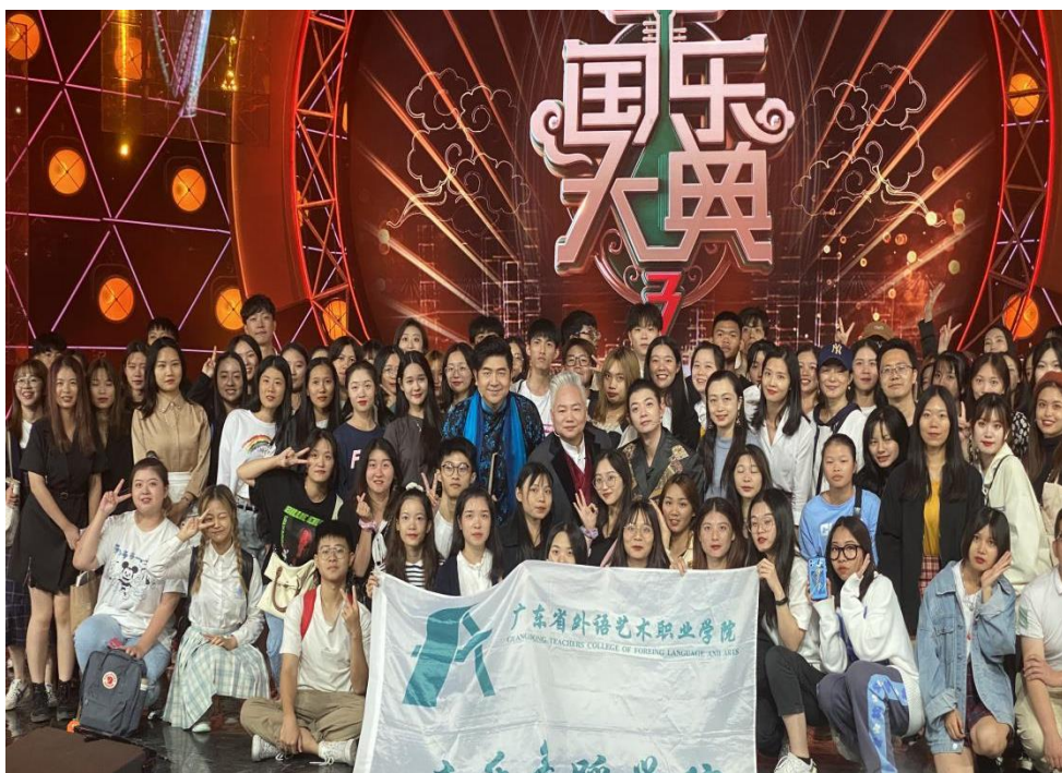
图 4：我校学生参与广东卫视《国乐大典》录制