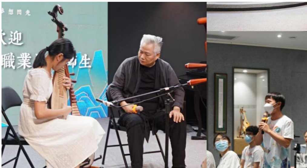
图 3：企业人员指导表演艺术专业学生开展校外实践

佛山锦音龙乐文化传播有限公司定期为表演艺术和相关专业的教师、学生提供各类实训实践项目。截至目前，佛山锦音龙乐文化传播有限公司给音乐舞蹈学院的学生提供了 3 项实训实践项目，共计约 300 人次学生参加。我校 6 位专业教师（共 9 人次）到佛山锦音龙乐文化传播有限公司参加社会实践，其中 2 位教师深入到企业进行专业技能培训，并与企业兼职教师一起共同参与学生的全程指导工作。